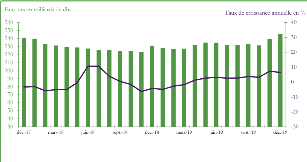
Graphique 3 : EVOLUTION DES RESERVES INTERNATIONALES NETTES